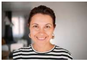
TITOLARE DI PISCINE BLU PROJECT BLU PROJECT

“ Grazie a Vendere più Piscine ho visto la luce in fondo al tunnel! L'azienda in cui sono socio è una realtà storica, da oltre 40 anni siamo specializzati in giardinaggio, ed operiamo fornendo soluzioni personalizzate principalmente nella provincia di Bari. Come ho conosciuto Vendere più Piscine? Online! Ero alla disperata ricerca di un'azienda esperta di marketing in grado di potenziare la mia presenza nel web in modo efficace. Navigando su internet, ho trovato vari portali ed agenzie, ma sono stato subito colpito da Vendere più Piscine perché era specializzata proprio nel mio settore! Li ho subito contattati per avere la conferma che potessero fare al caso mio e, che dire, sono davvero molto soddisfatto! Non solo hanno risolto il mio problema principale con strumenti e materiali specifici che hanno elaborato apposta per me, ma si occupano tutt'ora del mio piano marketing, sia online (sito, blog, social ecc...) sia con materiale fisico da dare alle persone durante una mia trattativa. Consiglio davvero a tutte le realtà del mio settore di farsi affiancare. ”