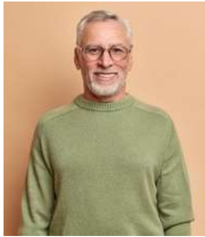
TITOLARE DI POOLSTECH UDINE